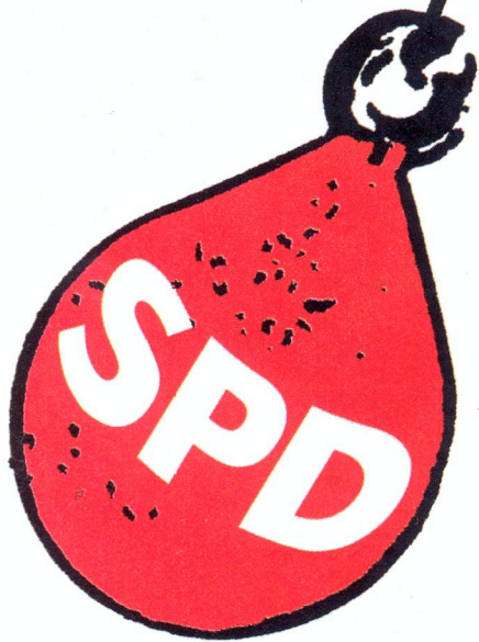
ILLUSTRATION: ANGELA GERLACH

bla bla bla bla bla bla ja ja ja ja bla bla ja